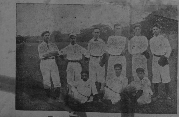
Team San José perdiendo