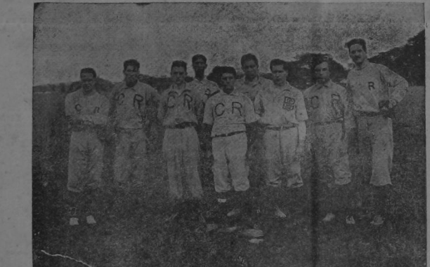
Team "Costa Rica" vencedor